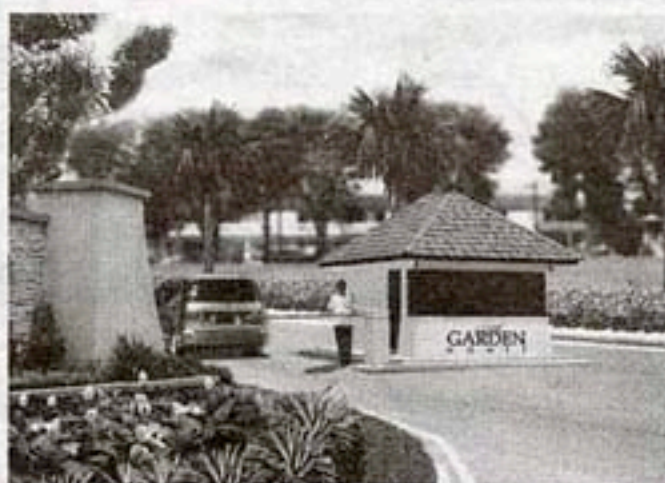
24小时围篱保安，为时下家庭提供最重要的住所安全保障。

整个Mutiara Puchong只有数百间双层房子，发展商精心设计以便每间房子都可轻易到达位于中央4英亩大的休闲公园。这里有足球