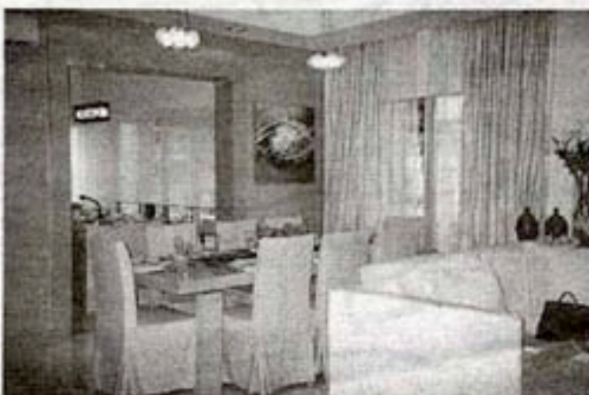
厨房与客厅格外广阔。

场、篮球场、多元用途场、羽球场、儿童游乐场、脚踏车道、跑步道、脚底按摩径、凉亭、藤架下散步小径等都是为居民营造一个高素质和康乐的生活方式。