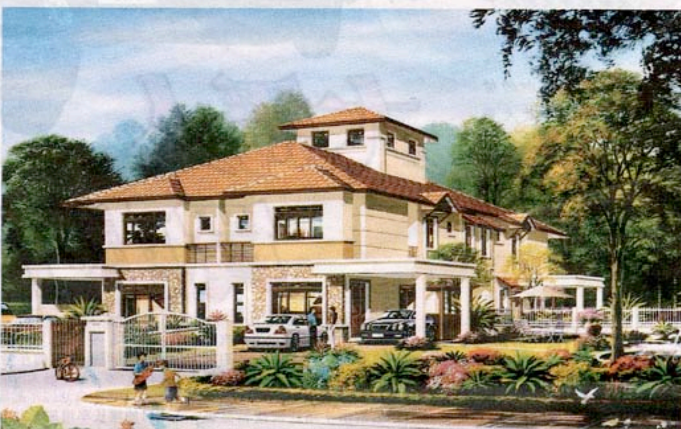
珍珠英达园双层半独立式排楼电脑绘图。

往来自蒲种珍珠英达园的捷径概括白蒲大道、沙亚南大道、南北衔接大道、南巴生河流域高速公路及KLIA机场大道等。双威镇、首邦市、金銮镇及武吉加里尔等，尽是显赫的邻亲。