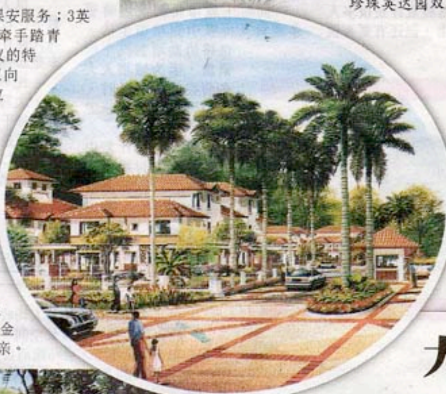
珍珠英达园局部规划图。